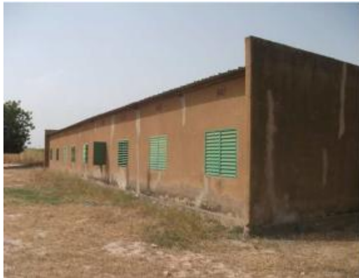
Ecole de Bélianvalsé

L'école du village est constituée de trois classes. Elle est publique et gratuite. L'enseignement se fait jusqu'au cours moyen primaire. Les classes manquent de filles ; elles aident les mères dans les tâches ménagères. Les classes supérieures (payantes) se trouvent dans le chef lieu de la commune rurale qui est Kyon.