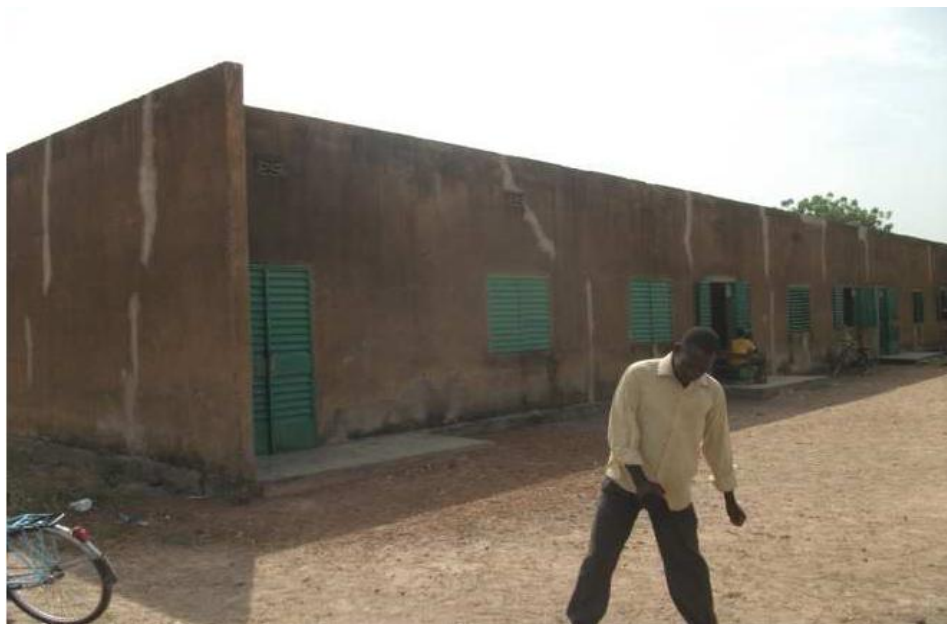
Ecole de Bélianvalsé

C'est l'association Nowon qui a pris l'initiative de contacter l'EAI, voici déjà trois ans, afin de normaliser l'école de Sassia. L'EAI étant déjà engagé sur d'autres projets n'avait pu répondre à cette proposition avant l'année dernière. Comme la collaboration s'est bien déroulée, nous avons voulu continuer ce partenariat.